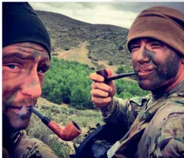
Min kammerat, jeg sad på vogn med til venstre, og mig til højre. Spanien, oktober 2015.