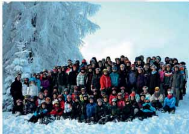
På skiferie med Dejbjerglund Efterskole.

Denne uddannelse tog to år og fire måneder. Igenem forløbet var jeg i praktik to gange, i min første praktik var jeg i Bækkehøj Børneunivers og i min sid-