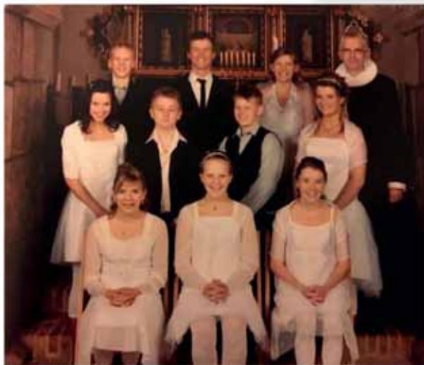
Konfirmander anno 2008, Jeg sidder i midten.

Jeg håber, at de næste 10 år vil byde på lige så mange og spændende oplevelser.