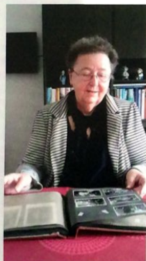
Mig som jeg ser ud i dag.