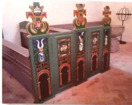
Til venstre ses de flotte kirkestole med de nye friske farver.