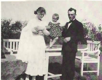
Min mor med Laurids, mig og far til min første lillebrors barnedåb.

samlet, og da løb os børn rundt hos naboerne og lavede løjer. Vi løb mest sammen med børnene ovre fra Fjords, men det var rigtig sjovt at stjæle kaffekande og trillebør osv.