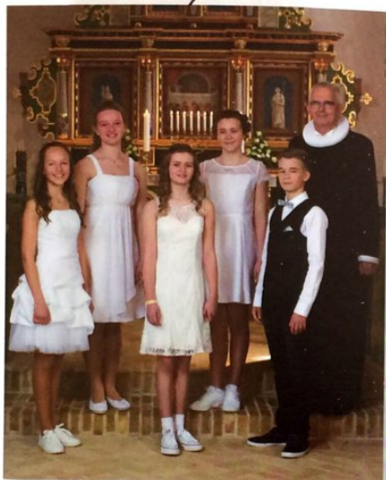
De fem smukke unge mennesker efter deres JA i Dejbjerg Kirke.